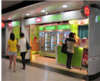
| Hung Fook Tong 지하철 역사 매장 |