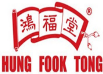
| Hung Fook Tong 브랜드 |